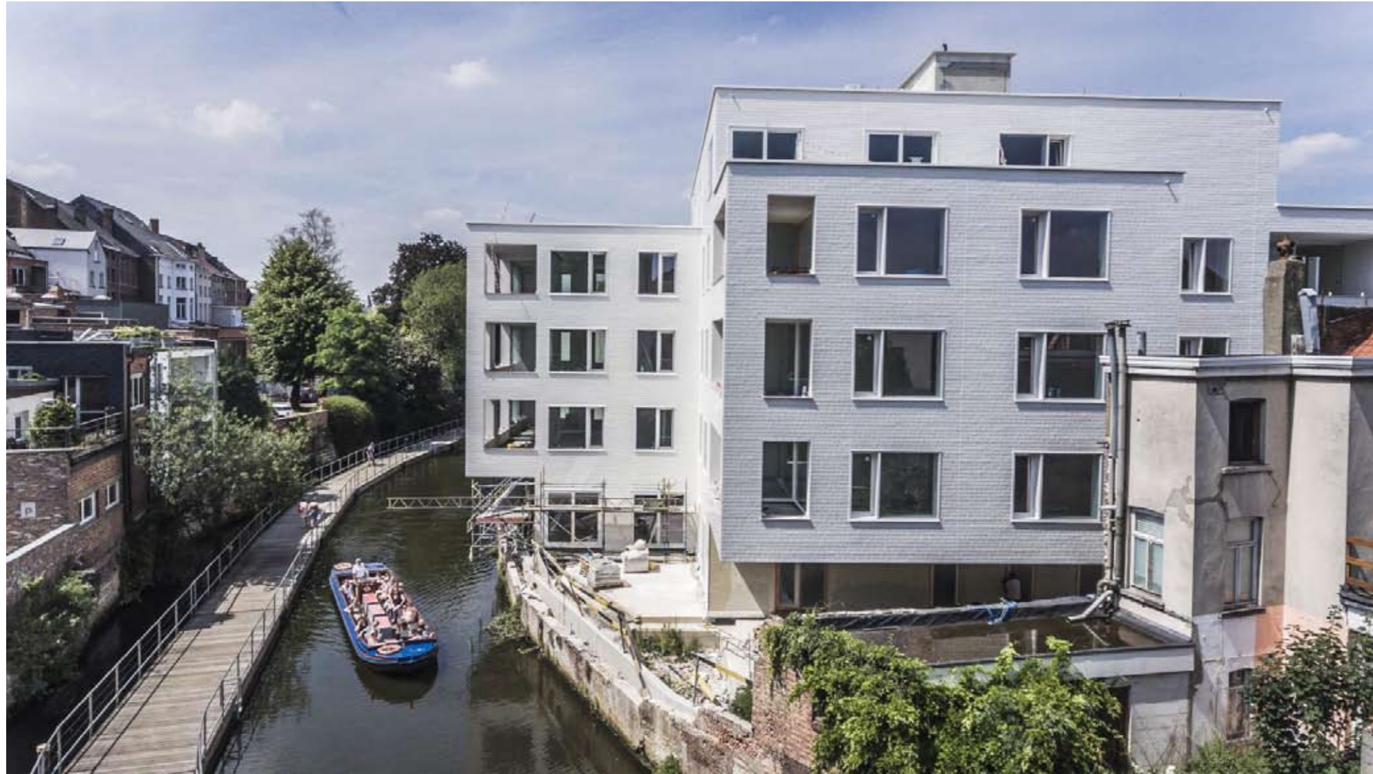
Referentie gevelbekleding. Appartementencomplex te Mechelen door Stephane Beel.