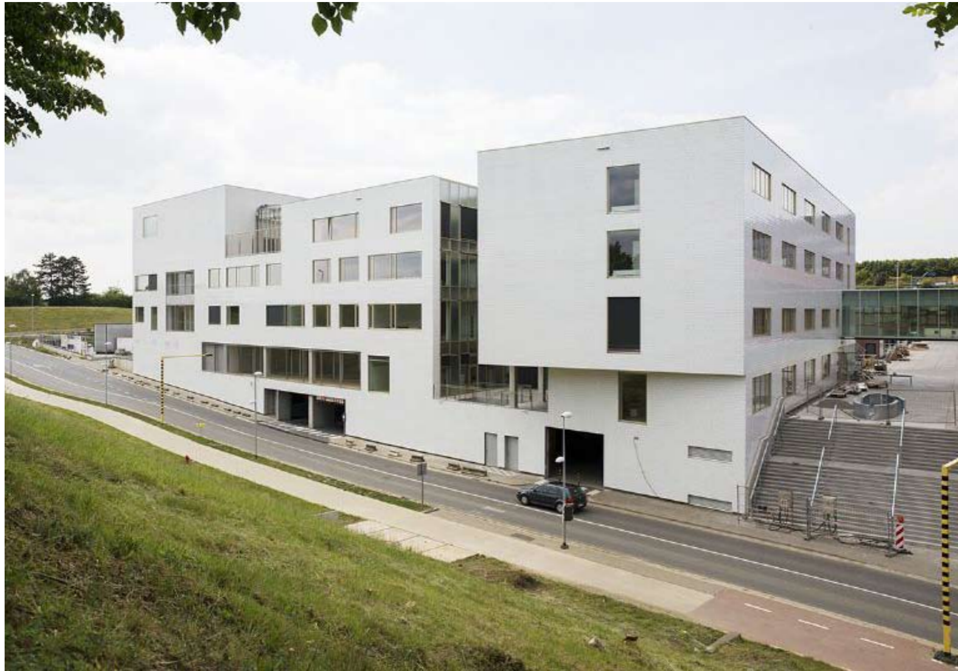
Referentie gevelbekleding. Psychiatrisch centrum Universiteit Leuven door Stephane Beel.